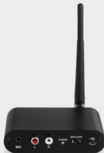
TRANSMISOR PARTY 3 CANALES