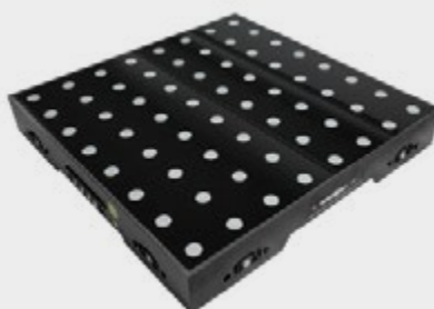
SLS-DF LED DIGITAL