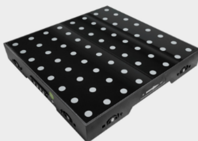
SLS-DF LED DIGITAL