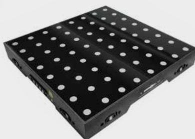
SLS-DF LED DIGITAL